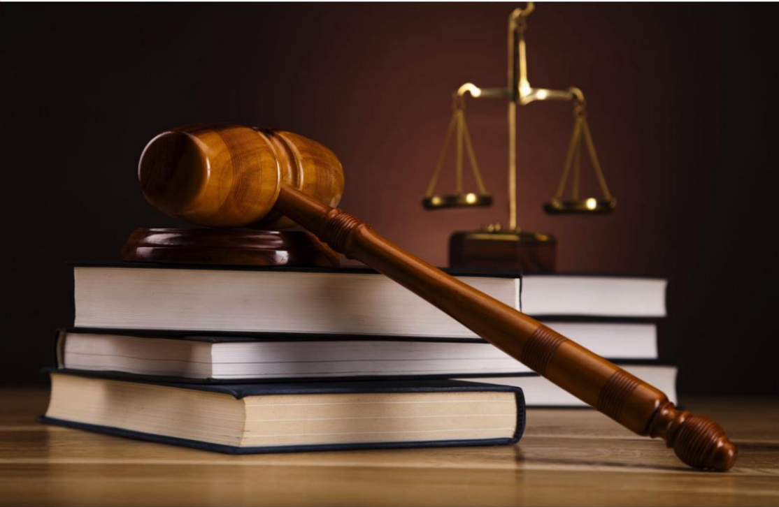
TABLEAU DE L'ORDRE

approuvé par le Conseil national de l'Ordre le 30 août 2019